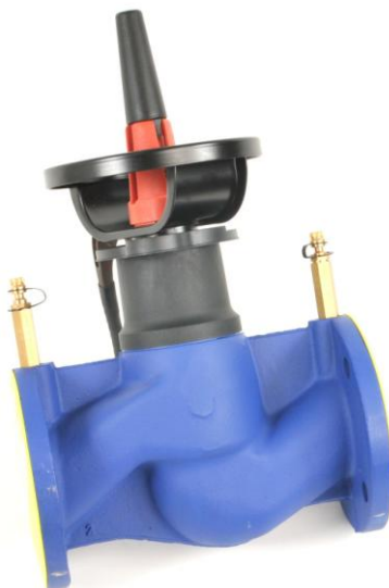
Måtnoggrannhet av Kv värden i %. Ventil 751B DN50 –DN 200