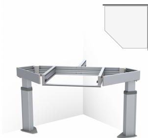
Hörnbänklyft Baselift Corner 6311HA, 45°- 90°, Golvmöglad