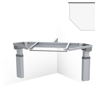
Hörnbänklyft Baselift Corner 6301LA, 45°- 90°, Vägghöglad