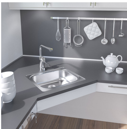
Insatsbänk med en disklåda kan integreras i hörnmodulen. Det går även bra att integrera spishäll i hörnmodulen.