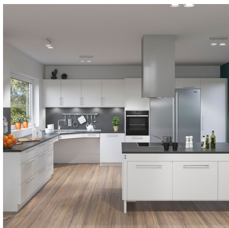
Hörnbänkyftare med 45° snedställd framkant ger gott om benutrymme under bänksplanet samtidigt som man får bra åtkomst till arbetsytorna på sidorna. Installationer under bänksplanet döljs med täckskivor.

BASELIFT CORNER är utrustad med ett tillförlitligt säkerhetssystem som säkerställer att användaren kan justera bänken utan risk för klänning eller skador. Lyftsystemet är förberett från fabrik för att underlätta en enkel och snabb installation, vilket gör att det går snabbt att sätta upp i olika typer av kök.