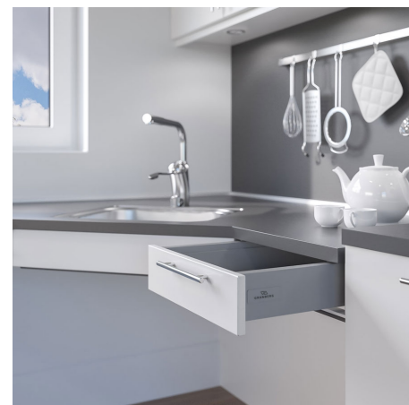
Låda kan integreras i bänksplanet.